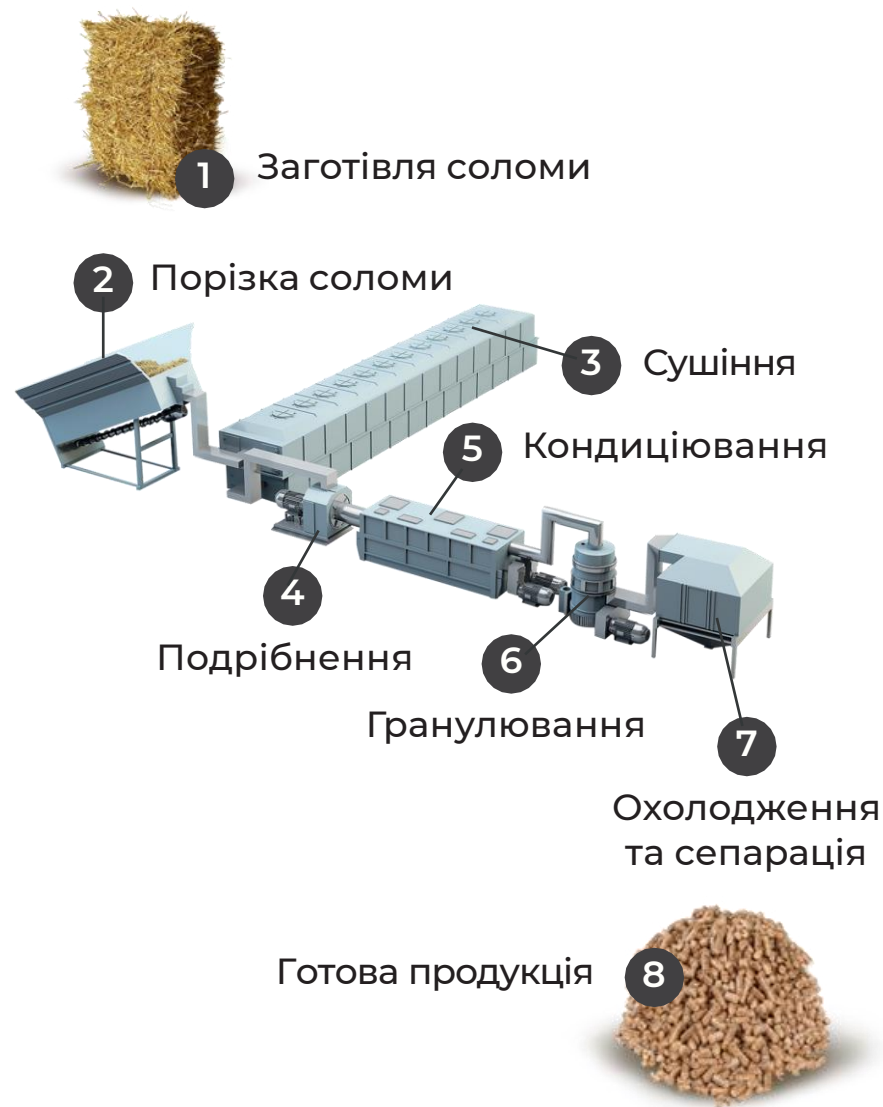
Схема виробничого ланцюга

PELEGREEN — найбільший експортер України пелет із соломи. Компанія здійснює 95% загального обсягу українського експорту, поставляючи продукцію до країн ЄС, Близького Сходу, Сейшельських островів та ін.